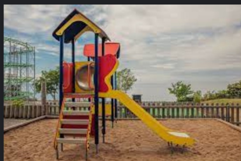
Lekplats - Kneippbyn kneippbyn.se