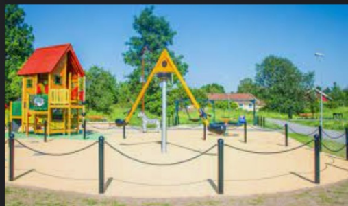
Knutby lekplats - Uppsala kommun uppsala.se