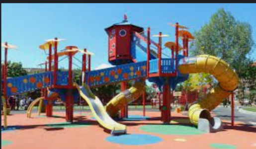
Lekplatsen För alla | helsingborg.se