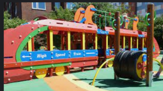
Lekplatsen För alla |