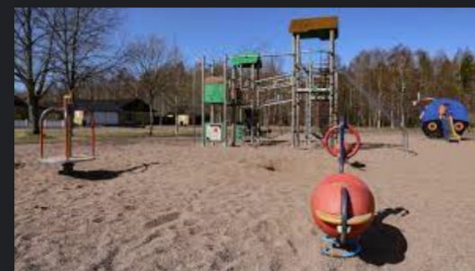
Söderängsparkens lekplats karlstad.se