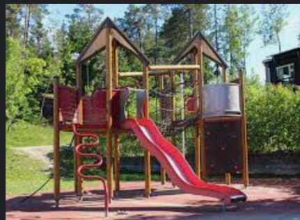
Vistabergs lekplats huddinge.se