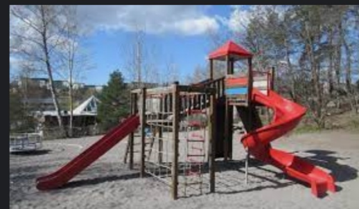
Lekplatser i Sjöberg