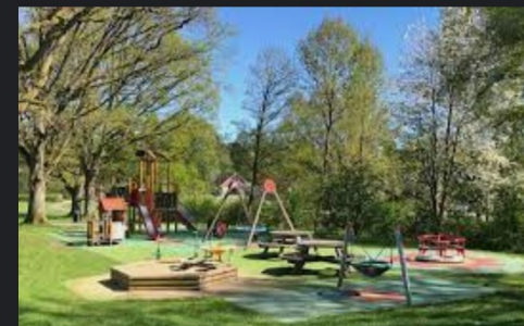
Lekplatser - Höörs kommun hoor.se