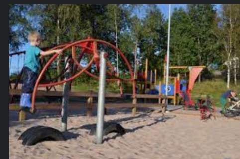
Lekplatser - Gislaved.se gislaved.se