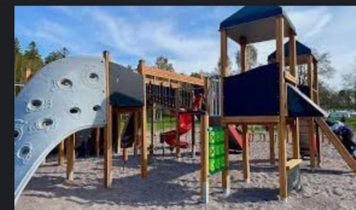
Lekparker - Nynäshamns kommun