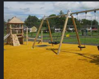
Lekplatser - Mölndal molndal.se