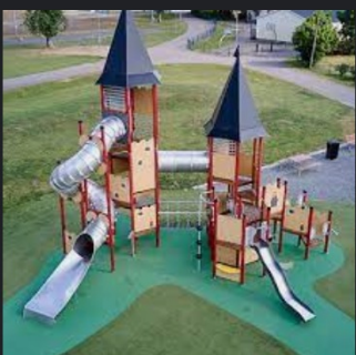
Lekplatsens utformning - HA... hags.se