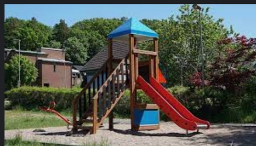
Lekplatser | ale.se ale.se